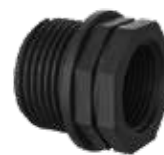
Réduit taraudé / fileté